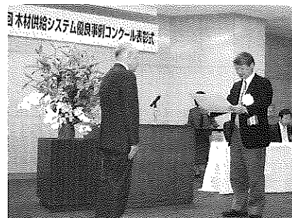
3月16日に行われた表彰式