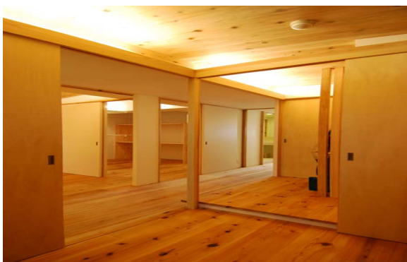
スギ樹皮と間伐材を使った無垢厚板遮音材 (株)マスタープランナー級建築士事務所