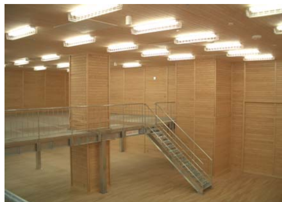
柱目調の幅広・横はぎの壁