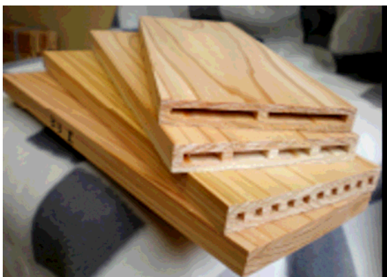
スギ材を活用した中空パネルを用いた内装材 (株)元尾商店