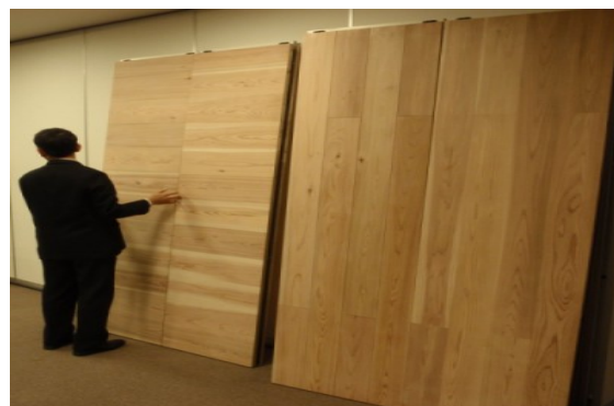
後施工が可能な国産材壁材(間仕切り) (株)コスモスイニシア